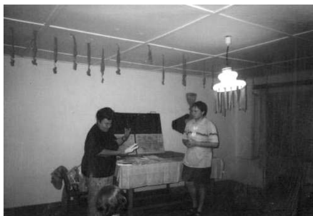
soustředění mladých historiků: