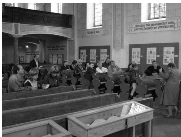
Fotky z Putování do Velké Lhoty u Dačic 9/9/2007 v rámci Festivalu řemesel a vyznání.