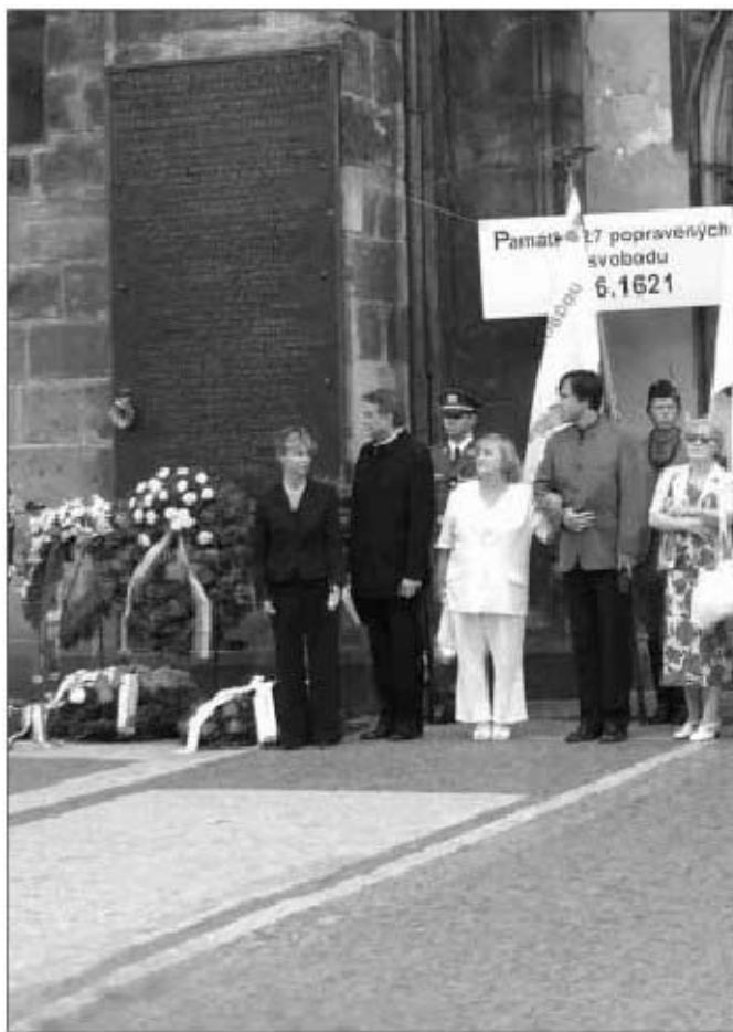
Ze slavnostního shromáždění k 385. výročí stavovské popravy

Dámy a pánové, i naše moderní, nedávné dějiny poznaly už poněkolkáté údobí ekonomické, majetkové, kulturní a duchovní devastace. Dnes vše nasvědčuje tomu, že alespoň na evropském kontinentě jsme dosáhli takového uspořádání, které zabraňuje tomu, aby se podobné věci a podobný vývoj ještě někdy opakovaly. Neznamená to nicméně, že bychom ve světle našich historických zkušeností nemohli a nesměli říkat své k tomu, kam a jak směřuje dnešní evropské uspořádání. Vzájemná obchodní a ekonomická provázanost evropských států a národů, jejich spolupráce všude tam, kde je to možné, volný pohyb osob, zboží, služeb a peněz – to jsou věci blahodárné, které podporují dobré partnerství, soužití a sousedství. Ale pokusy o zažehlení odlišných národních tradic do jedné ekonomické, právní, politické a kulturní šablony bez ohledu na různosti jejich vývoje – to je cesta špatná, která může v Evropě naopak staré démony nesnášenlivosti probudit.